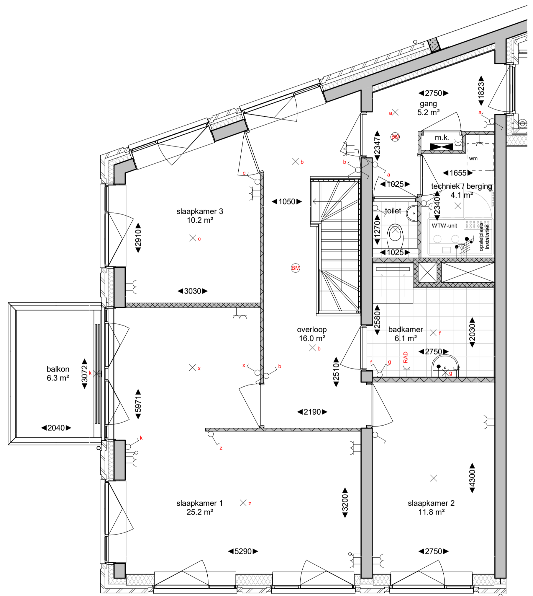
1e verdieping schaal 1 : 50